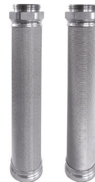
Filtereinsätze (Abb. glatte Ausführung)

Ausgelegt nach Druckgeräte-Richtlinie 2014/68/EU Druckgeräteart nach Art. 2: Behälter Fluid nach Art. 13: Gruppe 1 n. Art. 4, Abs. 3: gute Ingenieurpraxis